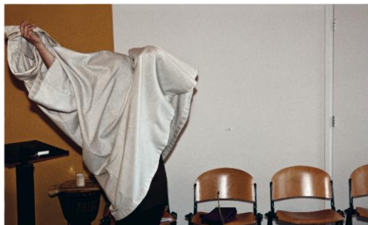
Een documentair fotoboek over zingeving