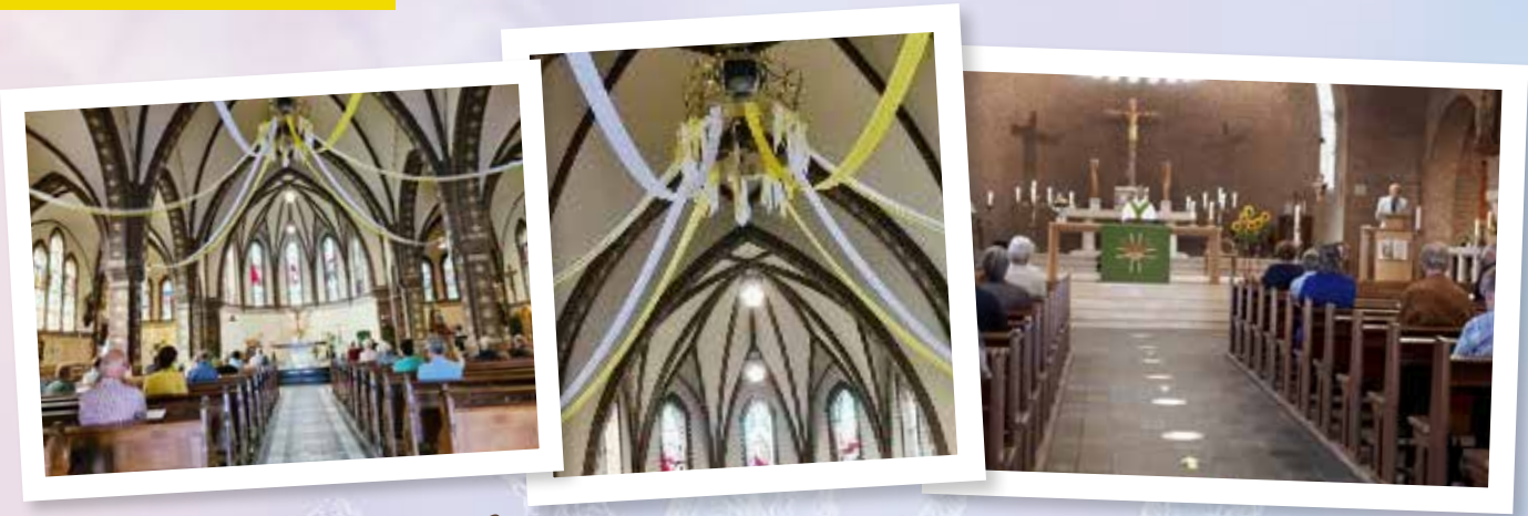
Zondag 2 augustus was er na Corona weer de 1e viering in de feestelijk versierde St. Catharinakerk, Barneveld,